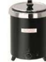
Suppentöpfe in verschiedenen Größen