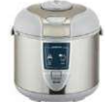
Reiskocher in verschiedenen Größen