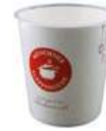
Behälter für den ToGo Markt

Gerne beraten wir Sie persönlich und stellen Ihnen, auf Ihre Bedürfnisse zugeschnittenes, Equipment zur Verfügung.