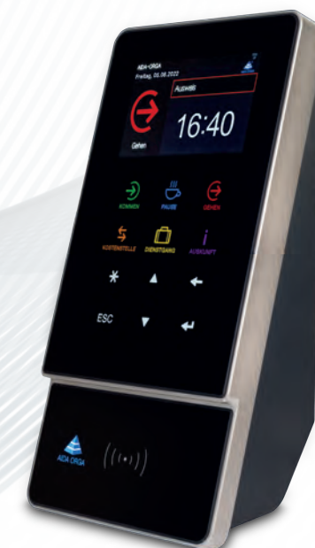
AIDA T1635 für Zeit, Zutritt und Kostenstellenwechsel