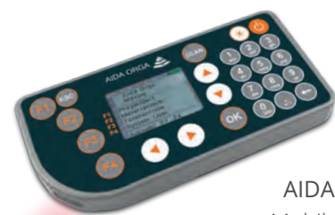
AIDA mT610 Mobilcomputer