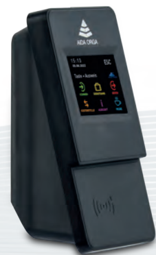
AIDA T1625 für Zeit, Zutritt und Kostenstellenwechsel