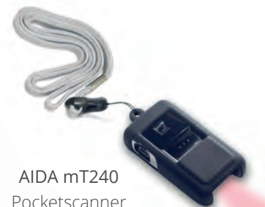
AIDA mT240 Pocketscanner