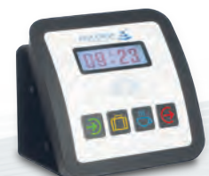
AIDA T40 für Zeiterfassung und Kostenstellenwechsel