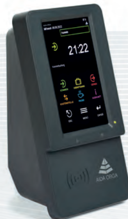
AIDA T1627 für Zeit, Zutritt und Web Selfservice