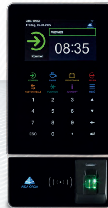
AIDA T1637 für Zeit, Zutritt und Kostenstellenwechsel