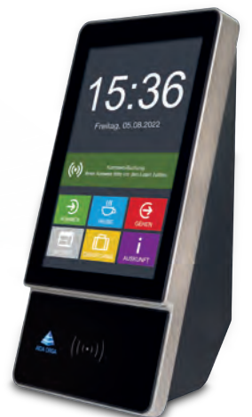
AIDA T1670 für Zeit, Zutritt und Web Selfservice