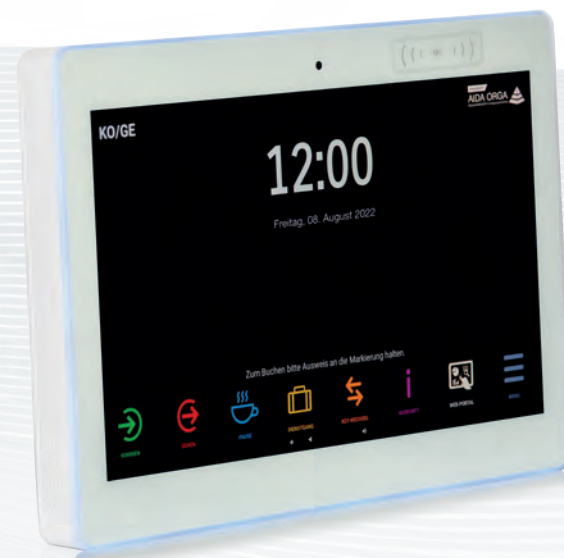
AIDA T513 (Smart Tablet-Terminal) für Zeiterfassung und Web Selfservice