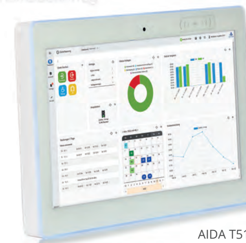
AIDA T513 (Smart Tablet-Terminal)

Vorgesetzte haben zusätzlich die Möglichkeit, definierte Ansichten und Auswertungen für die Mitarbeiter in den ihnen unterstellten Organisationsstrukturen aufzurufen, z. B. Jahres- und Gruppenfehlzeitkalender, Monatsjournale sowie An- und Abwesenheitsübersichten.